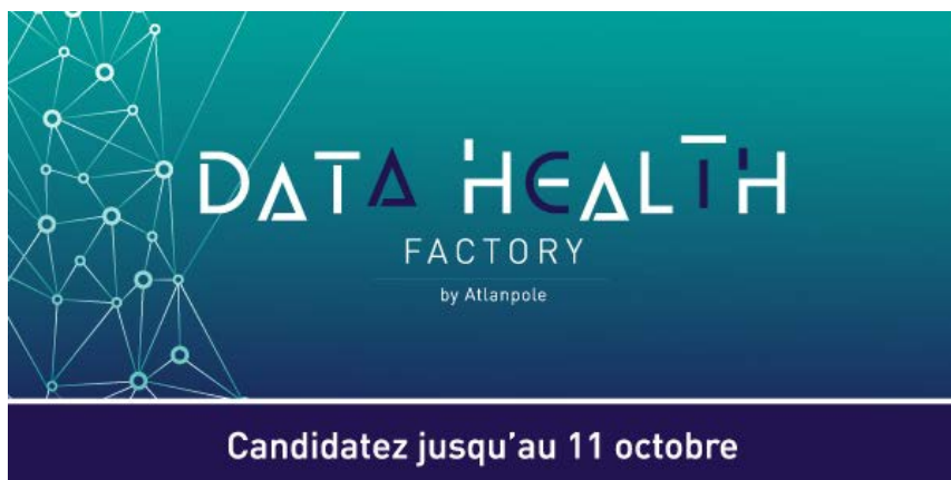
BANDEAU « APPEL À CANDIDATURES » À utiliser jusqu'au 11 octobre