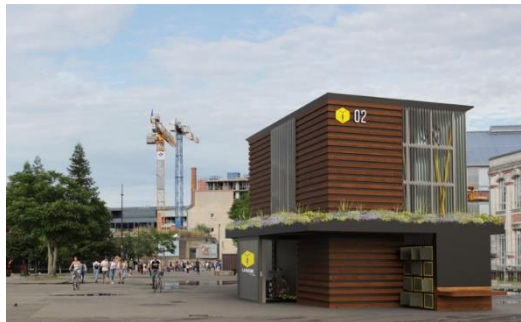
Prototype – parking Gare d'Angers – septembre 2020

La dotation versée par la Fondation participera à l'installation et à l'expérimentation du prototype.