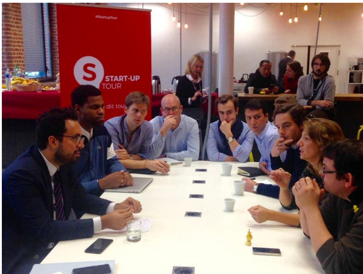
À Lille avec des entrepreneurs dans le cadre du tour des start-ups

« Ce tour des start-ups est une initiative intéressante car nous n'avons pas si souvent que cela l'occasion de nous exprimer. »