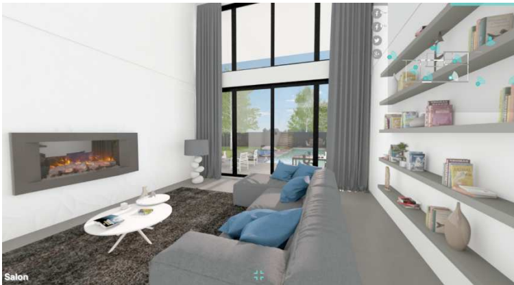
La visite virtuelle à 360° de l'ensemble d'une maison se fera prochainement en quelques clics avec les solutions Cedreo.

Cedar Architect est le seul logiciel au monde permettant à un novice de dessiner en quelques minutes l'intérieur et l'extérieur d'une maison en 3D. Cet outil ergonomique permet de visualiser et de meubler l'habitat grâce à une bibliothèque de plus de 3 000 produits et revêtements. Le résultat : des images de synthèse de qualité professionnelle et, très prochainement, des visites virtuelles 360°. Un logiciel inédit répondant aux besoins des constructeurs, promoteurs immobiliers, agents immobiliers, architectes, décorateurs, etc.